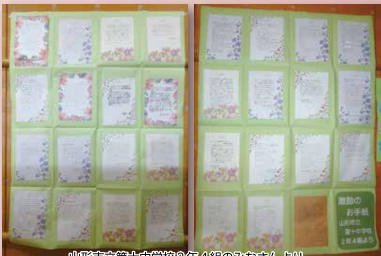
山形市立第十中学校2年4組のみなさんより、 メッセージが届きました。