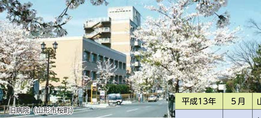
旧病院（山形市桜町）