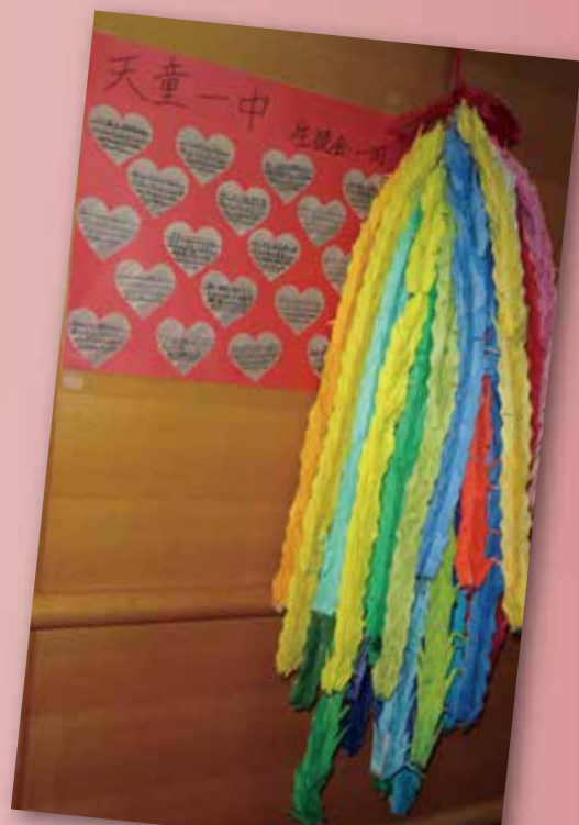
天童市立第一中学校の生徒会さんから メッセージと千羽鶴が届きました。