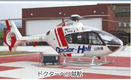
ドクターヘリ就航