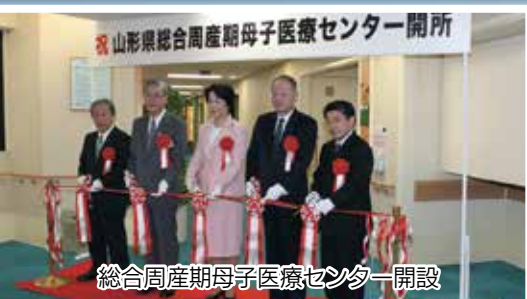
総合周産期母子医療センター開設